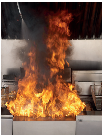
Süsteem aktiveerub Aeg = 15 sekundit