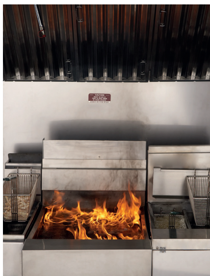
Tulekahju teke Aeg = 0 sekundit