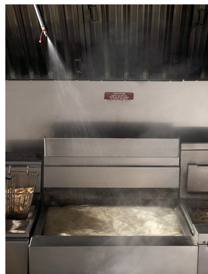
Tulekahju on kustutatud Aeg = 17,4 sekundit