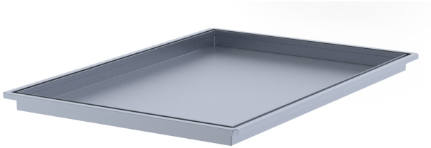
Ilmanvaihtokanavan pääty z-profiililla varustettuna.